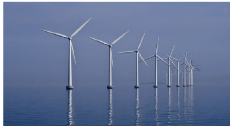
La mappa del futuro parco eolico

positività del parere del Mase, sarà necessario attendere il parere del Ministero dei beni culturali (teoricamente dovrebbe giungere entro 20 giorni) e nel caso sia positivo sarà riconosciuta l'autorizzazione principe, ossia la Via: «La transizione energetica del paese non può non passare dalla Romagna e dal porto di Ravenna. Qui si è fatta la sto-